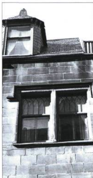
Fenêtres à guillotine des années 1920 avec châssis à deux carreaux.