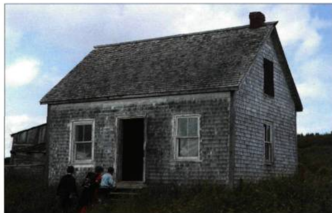
À l'île Bonaventure, cette maison abandonnée présente des fenêtres à guillotine qui datent du XIX e siècle.