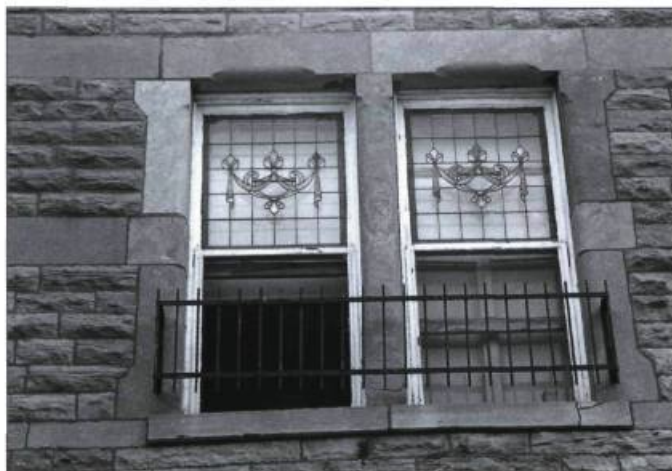
En ville, le châssis supérieur de la guillotine est souvent orné d'un vitrail.