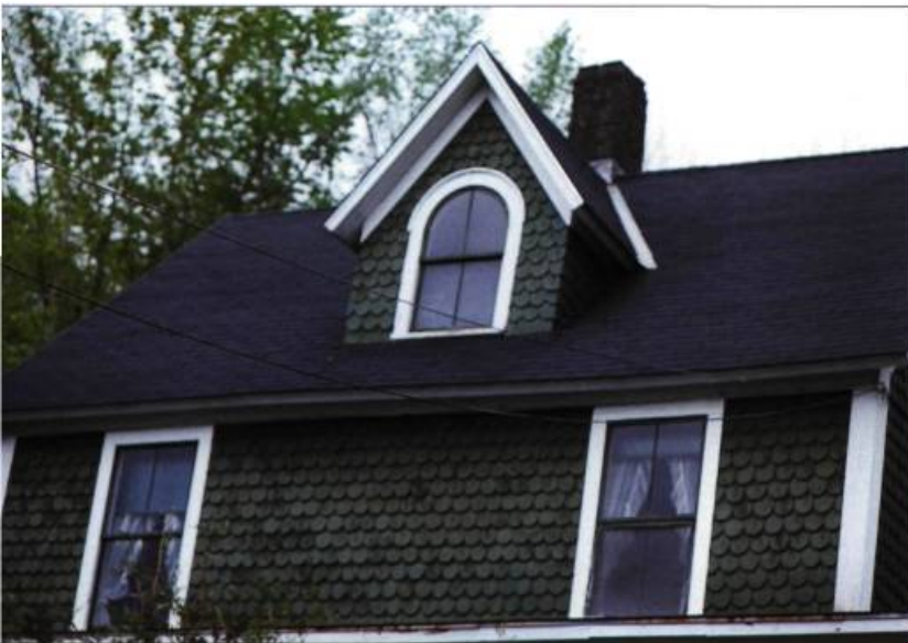
Ces trois belles fenêtres à guillotine, dont une cintrée dans la lucarne, datent du début du XX e siècle.